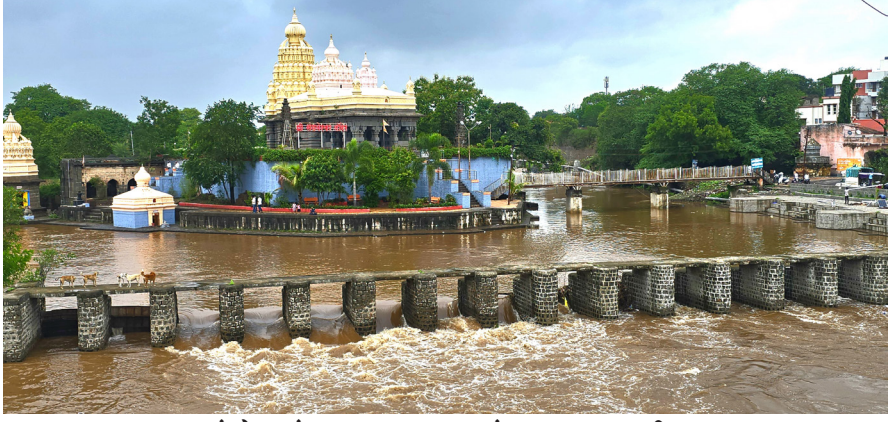
सासवड चा संगमेश्वर बंधारा वाहू लागला -पुरंदरच्या सासवड परिसरात समाधानकारक पर्जन्यवृष्टी झाल्याने येथील ऐतिहासिक आशा संगमेश्वर मंदिरा लगतच्या बंधाऱ्यावरून वाहणाऱ्या पाण्याचे मनमोहक दृश्य